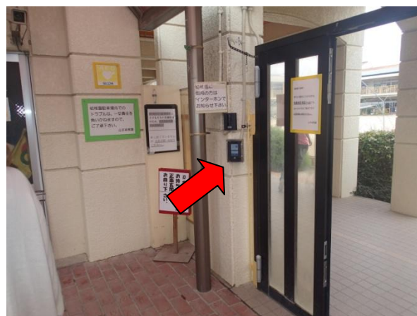
東門はチャイムの下に端末があります。 かざすと電子錠が解錠されます。