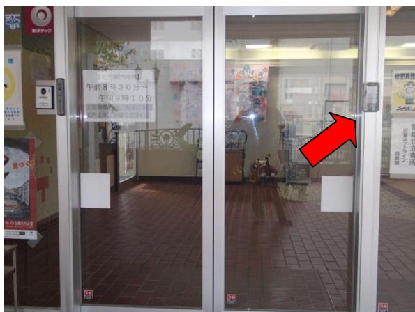
正面玄関は自動扉右側に端末があります。 かざすと自動扉が開きます。

紛失した場合は一時的に該当カードで開門出来ないように致しますので、必ず園までご一報を至急いただきますようよろしくお願いいたします。